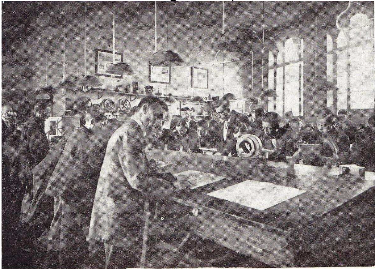
Cours pour chômeurs.

Nous qui les connaissons, avons plus de confiance en eux ; nous les avons vu souffrir avec un stoïcisme qui n'est que dans les âmes fières et hautes. N'est-ce pas aussi de leur milieu qu'était partie cette belle idée qui consistait à organiser à travers tout le pays, un vaste réseau d'oeuvres d'enseignement pour les chômeurs,